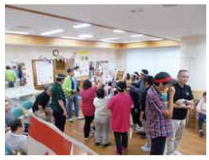
おお せいえん わら ごえ 大きな声援と、笑い声がっぱ うんどうかい いの運動会でした

きょう きょうぎ 「今日はどんな競技がある あさ りようしゃ の？」と、朝から利用者さんのに こえ あひ ぎやかな声が溢れていました。